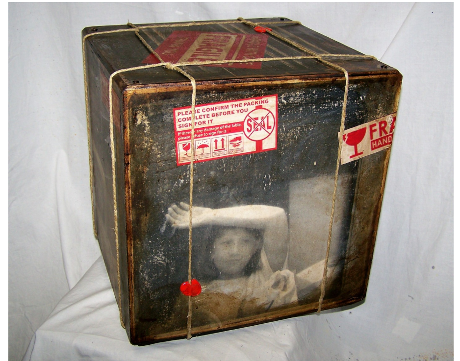
Fragile#11-legno tamburato-tecnica mista-cm30x30x30- 2016