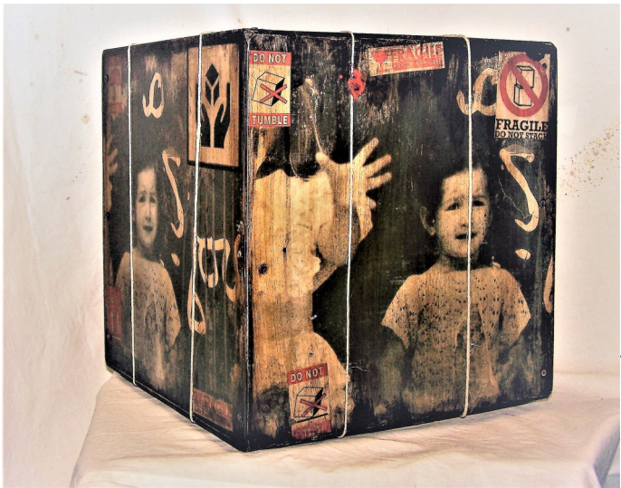
Fragile#6 -legno tamburato-tecnica mista- cm30x30x30- 2016