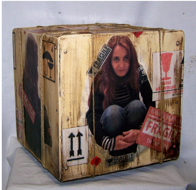
Fragile#9-legno tamburato-tecnica mista-cm30x30x30- 2016