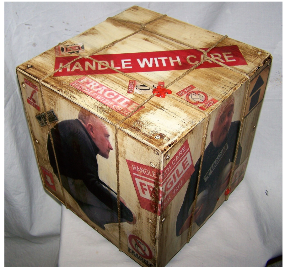
Fragile#8-legno tamburato-tecnica mista-cm30x30x30- 2016