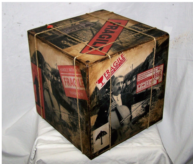
Fragile#12-legno tamburato-tecnica mista-cm30x30x30- 2016