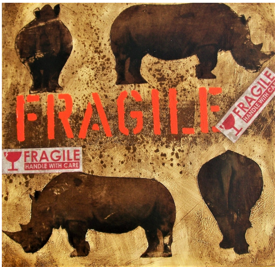
Fragile#5-tecnica mista su tela-cm40x40- 2016