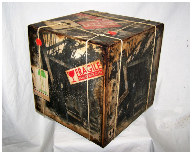
Fragile#10-legno tamburato-tecnica mista-cm30x30x30- 2016