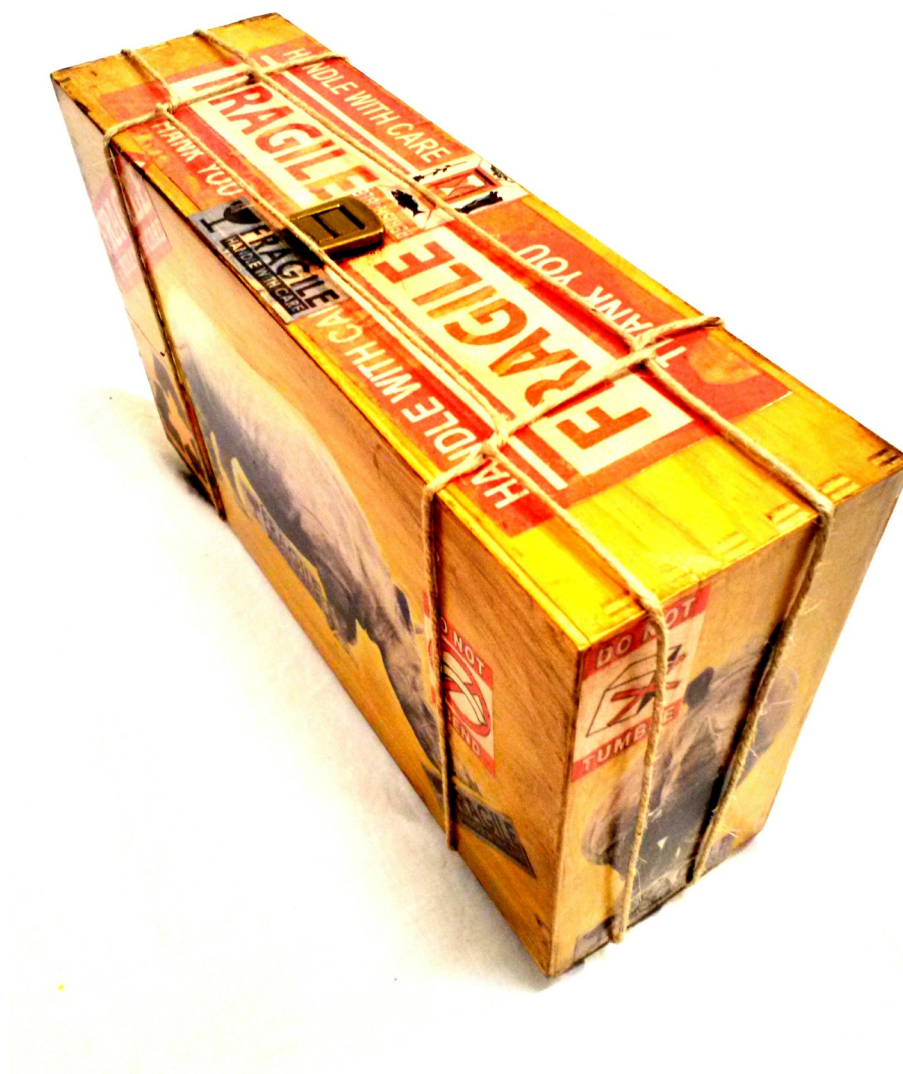
Fragile#1 -legno tamburato-tecnica mista-cm20x34x10- 2016