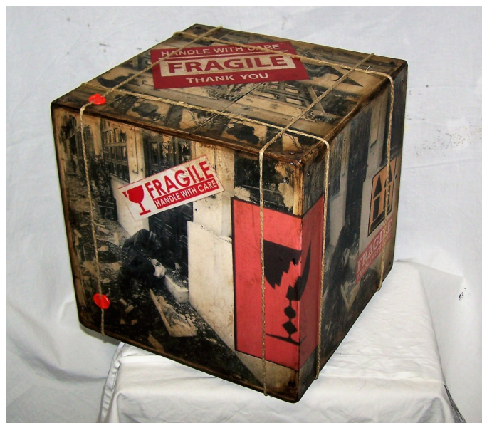
Fragile#13-legno tamburato-tecnica mista-cm30x30x30- 2016