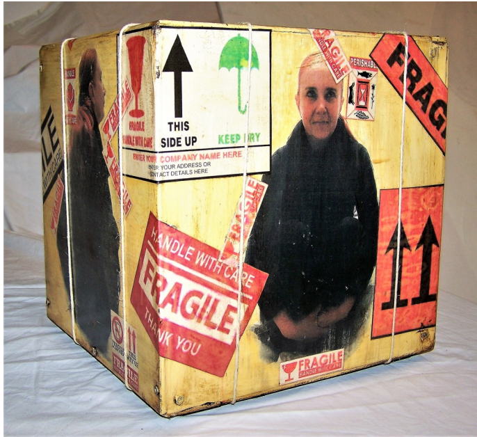
Fragile#2(self) -legno tamburato- tecnica mista- cm30x30x30- 2016